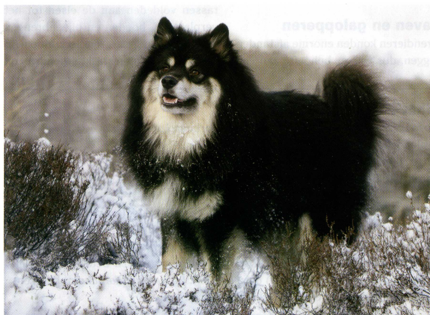
↑ Finse Lappenhond.